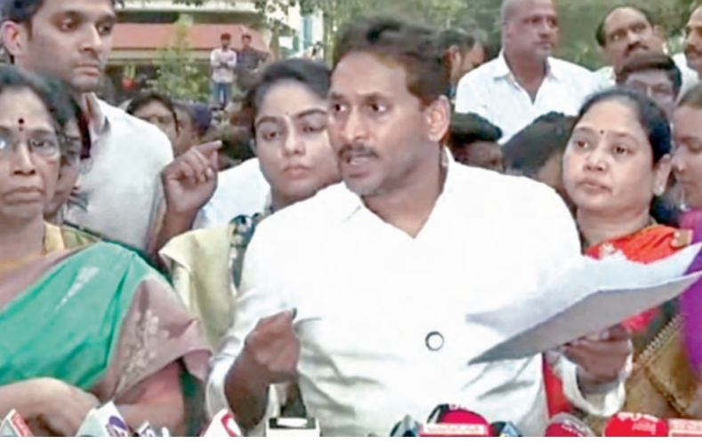
బుధవారం గుంటూరులో మీడియా సమావేశంలో మాట్లాడుతున్న మాజీ సీఎం జగన్

వచ్చేది మా ప్రభుత్వమే, అన్నిటిపై ఎంక్వెరీ వేస్తాం గుంటూరులో అంబటి రాంబాబు ఇంటికి వచ్చి కుటుంబసభ్యులతో మాట్లాడిన మాజీ సీఎం జగన్