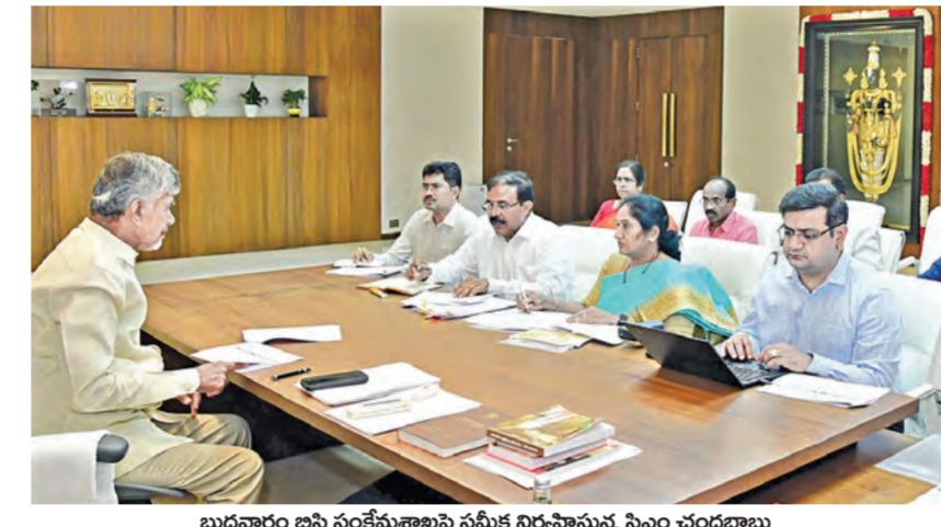
బుధవారం బసి సంక్షేమశాఖపై సమీక్ష నిర్వహిస్తున్న సీఎం చంద్రబాబు

ముడి పొగాకు ఉత్పత్తులపై జీరో సుంకం కేంద్రానికి మద్దతు ఇచ్చిన సీఎం చంద్రబాబు విజయవాడ, ఫిబ్రవరి 4 ప్రభాతవార్త ప్రతినిధి: ఎలాంటి ట్రాండ్ లేని ముడి పొగాకు ఉత్పత్తులపై ఎక్సైజ్ సుంకాన్ని సున్నాకు తగ్గిస్తూ కేంద్ర ప్రభుత్వం తీసుకున్న నిర్ణయాన్ని స్వాగతిస్తున్నట్లు ముఖ్యమంత్రి చంద్ర బాబు నాయుడు తెలిపారు. ఐది రాష్ట్రంలో జరిగే అనేక ట్రాండ్స్ పొగాకు వాణిజ్యానికి ప్రయోజనం చేకూరుస్తుందని ఆయన అభిప్రాయం వ్యక్తం చేశారు. ఈమేరకు కేంద్ర ఆర్థిక శాఖ జారీ చేసిన గెజిట్ ను అంద్రప్రదేశ్ ప్రభుత్వం పరిగణనలోకి తీసుకుంది. శుద్ధిచేయని పొగాకుకు (హెచ్ఎస్ కోడ్ 2401) వర్తింపే